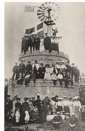
23. juni 1907

Efter fotograferingen var der rundvisning på vandværket.