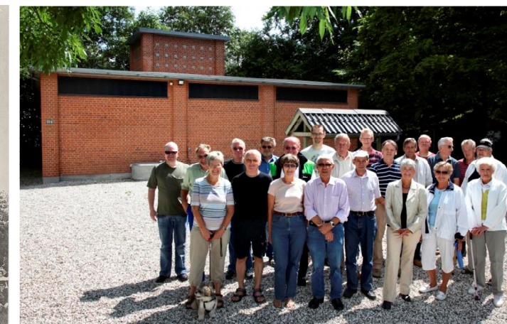
23. juni 2007