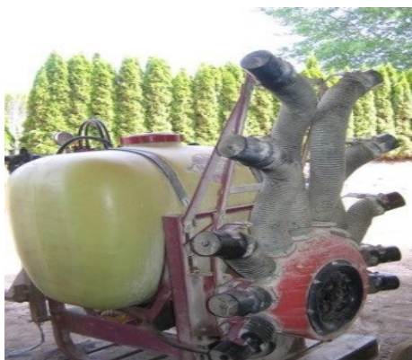
TÅGESPRØJTE MED BLÆSER