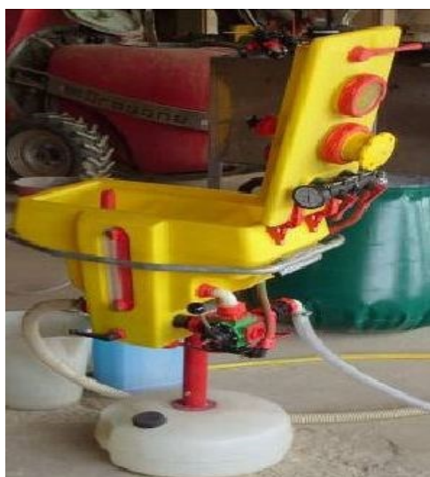
PRÆPARATFYLDEUDSTYR, HVORFRA SPRØJTEMIDLERNE SUGES OP I SPRØJTEN

En tredje løsning kan være montering af udstyret på en mobil enhed. Anvendelse af sugeudstyr kombineret med separat skylning på f.eks. vaskepladsen er også acceptabelt. Sugeudstyr kan alene anvendes til at fylde flydende plantebeskyttelsesmidler på sprøjten, ikke til granulater.