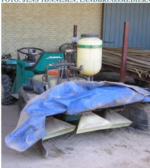
SPECIALSPRØJTE I PLANTESKOLE