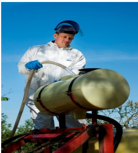
RENTVANDSTANK EFTERMONTERET PÅ EN MARKSPRØJTE

Rentvandstanken er en vandtank, der indeholder rent vand til indvendig og eventuel udvendig rengøring af en sprøjte. Tanken kan være en integreret del af sprøjtens konstruktion eller være monteret som ekstraudstyr. Rentvandstanken kan også være monteret som fronttank på den traktor, der bærer eller trækker sprøjten. I nogle tilfælde kan det være relevant, at rentvandstanken på anden måde er mobil (afsnit 4.2).