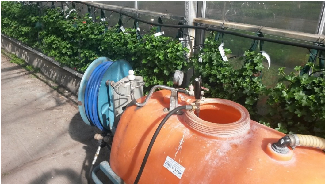
SPRØJTE MED SPULEDYSE TIL AT SKYLLE TOM EMBALLAGE.