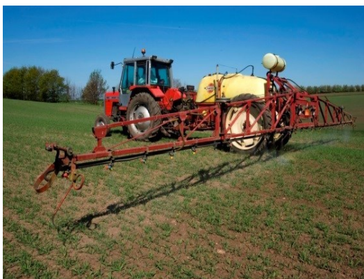
MARKSPRØJTE MED BOM

Bekendtgørelsens definition af marksprøjter omfatter både horisontale marksprøjter med bom, vertikale sprøjter, dvs. tågesprøjter med blæser og ATV-sprøjter. En række specialbyggede sprøjter til forskellige formål er også omfattet. Eksempler på dette kan være tunnelsprøjter, der anvendes i bl.a. jordbær, og båndsprøjter, der kan være monteret på en radrenser eller andre former for redskaber.