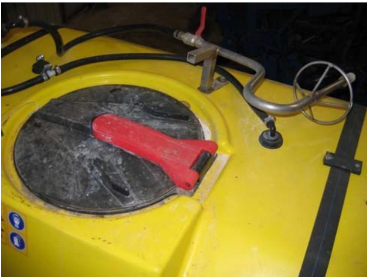
TÅGESPRØJTE MED MONTERING AF DUNK TIL SKYLNING AF TOM EMBALLAGE.