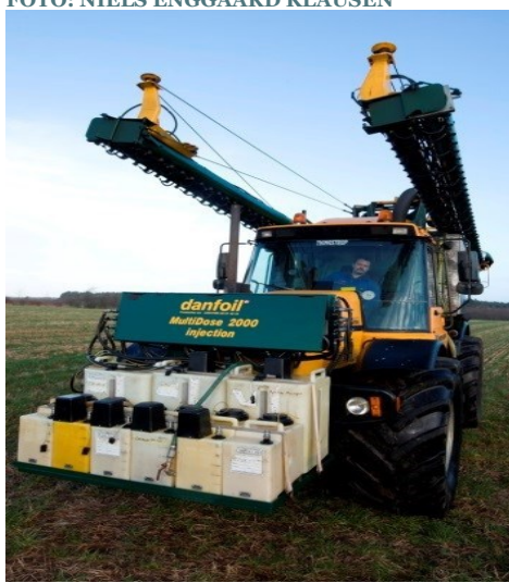
MARKSPRØJTE MED INJEKTIONSSYSTEM