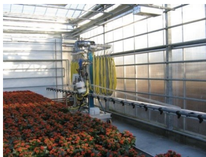
OPHÆNGT VÆKSTHUSSPRØJTE

I væksthuse anvendes flere typer af sprøjter til udbringning af sprøjtemidler. I større væksthuse vil der ofte være ophængte sprøjtebomme, der kan bevæge sig hen over kulturen. Mobile sprøjter med sprøjtelanse eller bom anvendes typisk i mindre væksthuse, men anvendes også i større gartnerier til nogle sprøjteopgaver.