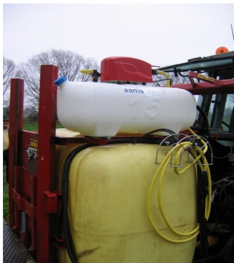
RENGØRINGSSÆT MED RENTVANDSTANK, SPULEDYSE OG RENGØRINGSLANSE TIL EFTERMONTERING