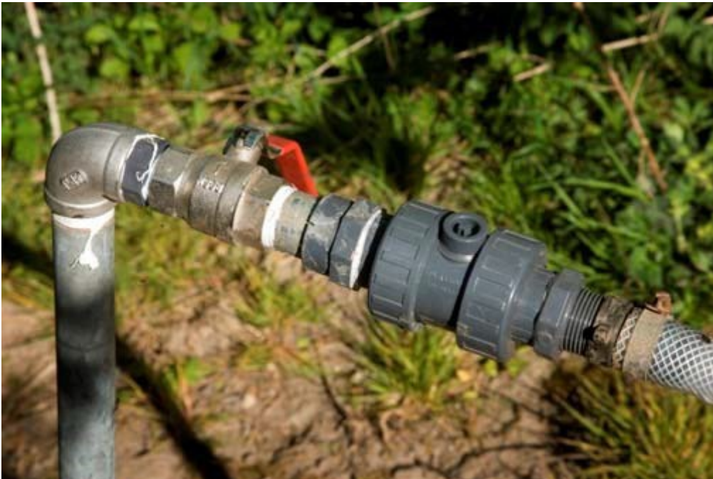
KONTRAVENTIL PÅ TAPSTED ER EN LØSNING TIL AT FORHINDRE TILBAGELØB TIL LEDNINGSNET

Vandpåfyldningsudstyret skal være således indrettet, at vandslangen ikke kan komme i direkte kontakt med væsken i sprøjtebeholderen. Det kan eksempelvis ske ved, at der etableres en rørføring, der gør det muligt at tappe vand direkte ned i sprøjtebeholderen. Er ledningsføringen således indrettet, at vandet med henblik på at undgå skumning ledes ind i bunden af tanken, skal der være etableret hævertbryder, således at der suges luft ind i rør eller slange, så snart vandstrømmen afbrydes.