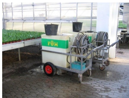
MOBIL VÆKSTHUSSPRØJTE