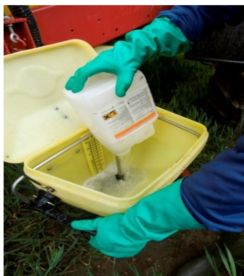
EN SPULEDYSE SIKKER EN NEM OG SIKKER SKYLNING AF TOM EMBALLAGE