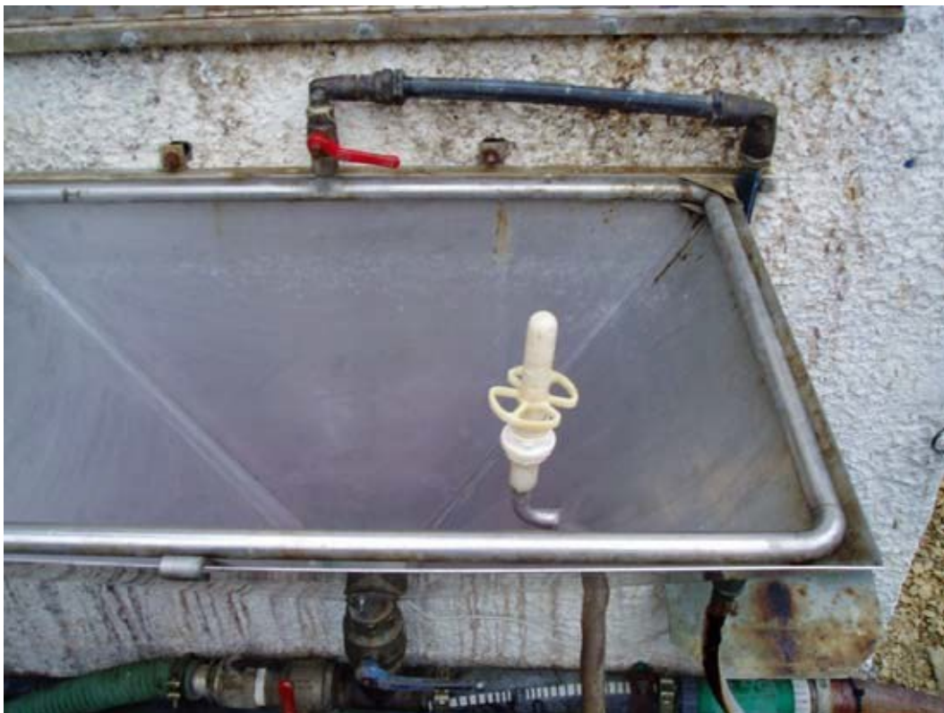
FAST MONTERET PRÆPARATFYLD, HVORFRA SPRØJTEMIDLERNE SUGES OP I SPRØJTETANKEN. ENHEDEN ER UDSITYRET MED SPULEDYSE TIL TOMME DUNKE

På nogle sprøjter - eksempelvis visse tågesprøjter - tillader konstruktionen ikke montering på selve sprøjten. I sådanne tilfælde vil det være muligt at montere præparatfyldeudstyr fast på vaskepladsen med opsamling af vaskevand eller som en mobil enhed, der kan medbringes ved påfyldning på det areal, der skal behandles.